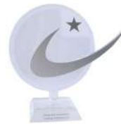
الشيخ خليفة للتميز 2018

Happiest Staff Accommodation Facility 2018