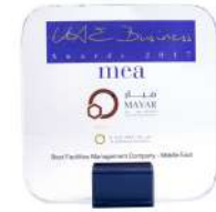
أفضل إدارة مرافق 2017

Happiest Staff Accommodation Facility 2017