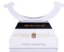
أسعد مدينة عمالية 2018

Happiest Staff Accommodation Facility 2018